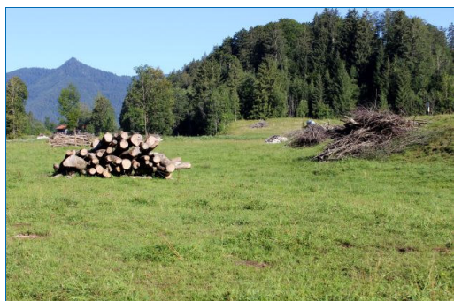
Abb. 2: Habitatstrukturen an Land - Totholz- und Steinhaufen