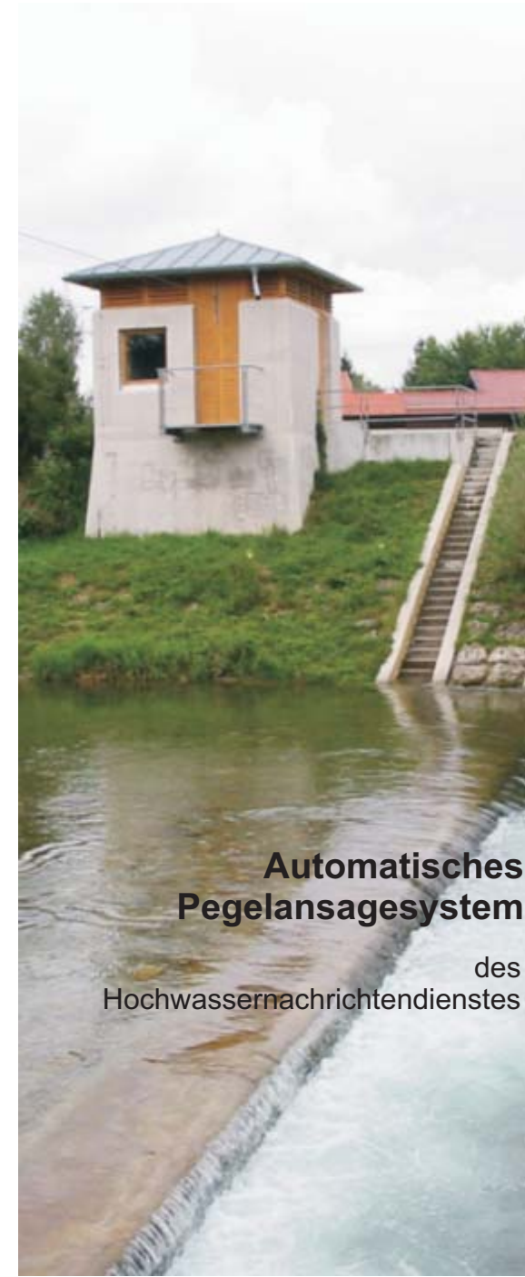
Automatisches Pegelansagesystem des Hochwassernachrichtendienstes

BAYERN | DIREKT ist Ihr direkter Draht zur Bayerischen Staatsregierung. Unter Telefon 089 12 22 20 oder per E-Mail unter direkt@bayern.de erhalten Sie Informationsmaterial und Broschüren, Auskunft zu aktuellen Themen und Internetquellen sowie Hinweise zu Behörden, zuständigen Stellen und Ansprechpartnern bei der Bayerischen Staatsregierung.