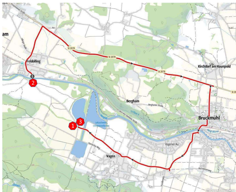
Abb. 1: Umfahrung während der Sperrzeiten der Kreisstraße RO13 beim HRB Feldolling

Ort – Feldolling (Gemeinde Feldkirchen-Westerham)