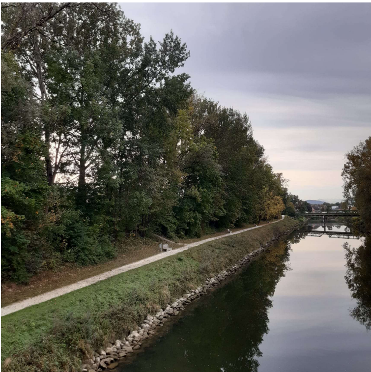
Abbildung 2: Gehölzbestand im Bereich Uferweg Mangfall Innspitz - Blickrichtung flussaufwärts