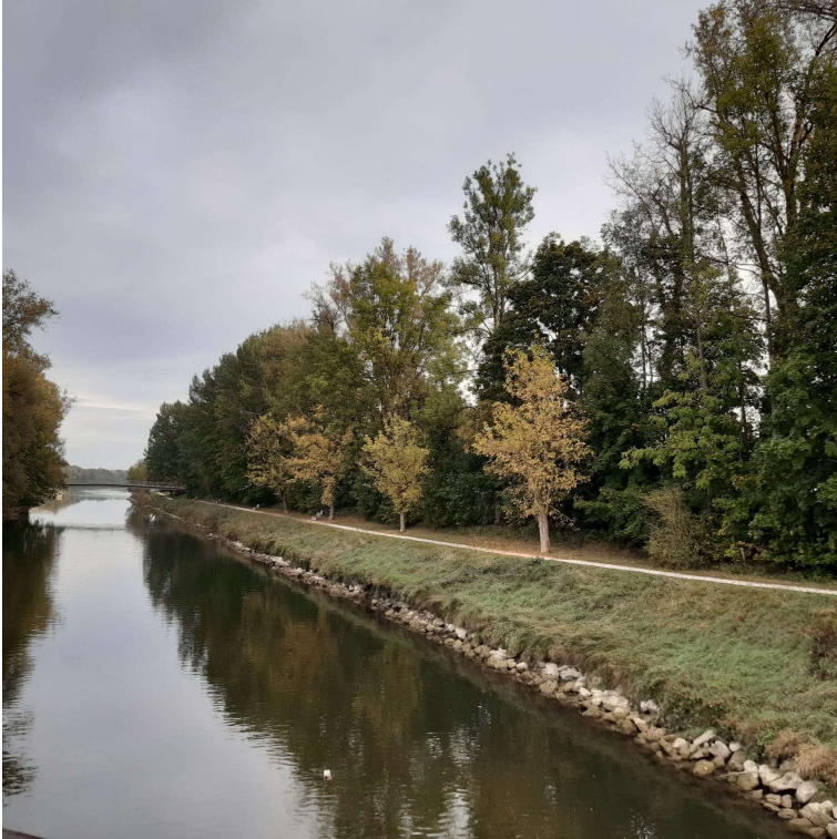
Abbildung 1: Gehölzbestand im Bereich Uferweg Mangfall Innspitz - Blickrichtung flussabwärts