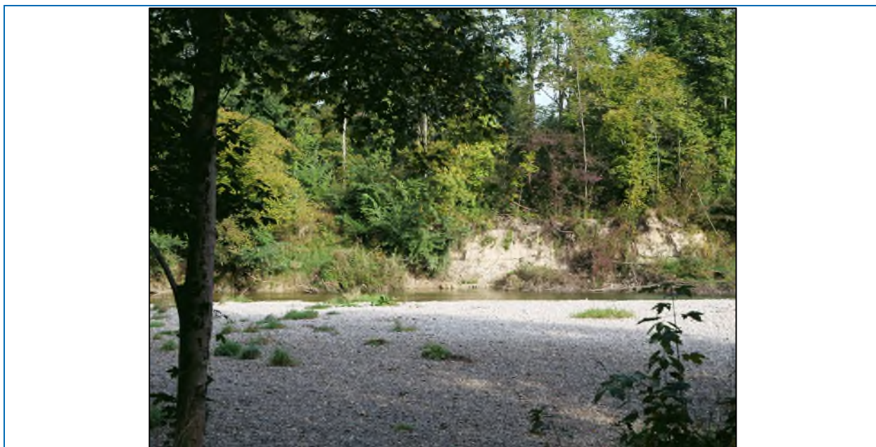
Abb. 3: Aufgestellt wurde die Infotafel an der Mangfall in der Nähe der Auerbachmündung.